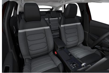
AMBIENTE URBAN GREY