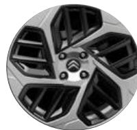
18-Zoll-Leichtmetallfelgen "Aeroblade" Anthra Grau