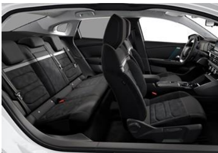
AMBIENTE ALCANTARA GREY UND KUNSTLEDER BLACK