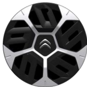
18-Zoll-Stahlfelgen mit Radzierkappen "Aerotech"