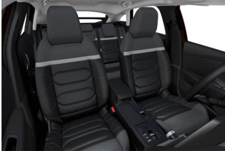
AMBIENTE METROPOLITAN GREY