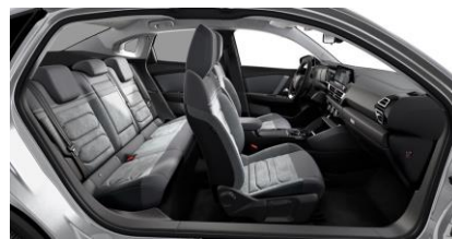
AMBIENTE ALCANTARA UND KUNSTLEDER GREY