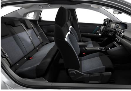
AMBIENTE "MEANWHILE" SCHWARZ