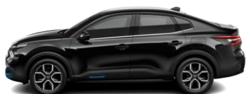
PERLA NERA-SCHWARZ (M)