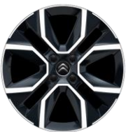
18-Zoll-Leichtmetallfelgen „CROSSLIGHT“ glanzgedreht