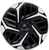
18-Zoll-Leichtmetallfelgen "Aeroblade" glanzgedreht