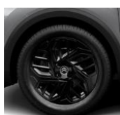
18-Zoll-Leichtmetallfelgen "Aeroblade" in Schwarz