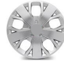
15-ZOLL-RADKAPPEN ZIAT 50,00 (59,50)