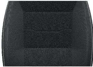
Premium Sitzbezug „Crepe Black“ schwarz BUFX 400,00 (476,00)