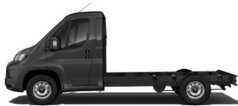
GRAPHIT GRAU M0E9 700,00 (833,00)