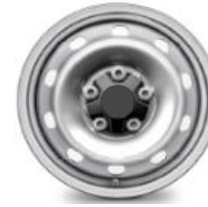
16-ZOLL-FELGEN ZIAS 0,00 (0,00)