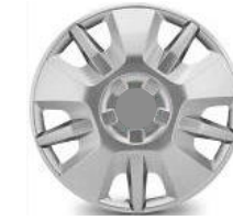
16-ZOLL-RADKAPPEN ZIAV 50,00 (59,50)