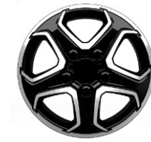
16-ZOLL-LEICHTMETALLFELGEN ZIBB 700,00 (833,00)