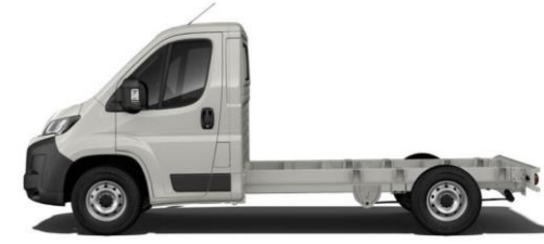
EXPEDITION GRAU P04K 350,00 (416,50)