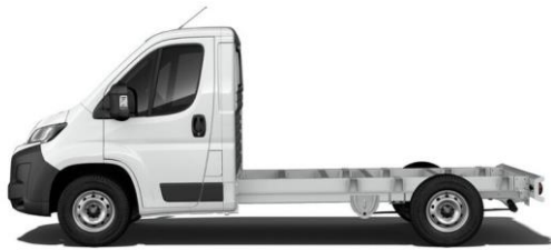
WEISS POPR 0,00 (0,00)