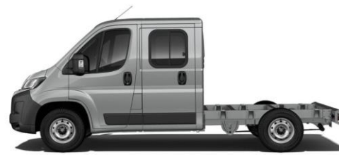
STAHL (ARTENSE) GRAU M0F4 700,00 (833,00)