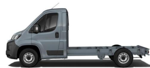
EISEN GRAU M0ZW 700,00 (833,00)