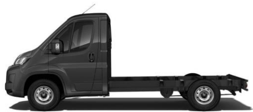
GRAPHIT GRAU M0E9 700,00 (833,00)