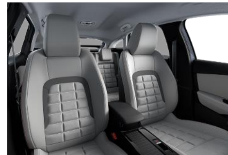
AMBIENTE HYPE IN GRAU ALCANTARA / KUNSTLEDER GRAU ADVANCED COMFORT SITZE