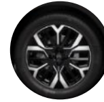
18-Zoll-Leichtmetallfelgen "Amber" glanzgedreht