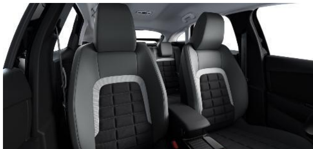
AMBIENTE URBAN GRAU STOFF-/ Kunstleder in BLAU ADVANCED COMFORT SITZE