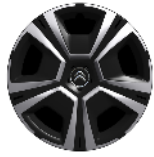
16-Zoll-Stahlfelgen mit Radzierkappen "Steel & Style"