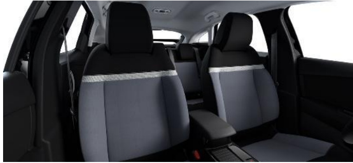
SERIENMÄSSIG STOFF "MEANWHILE" in GRAU/SCHWARZ