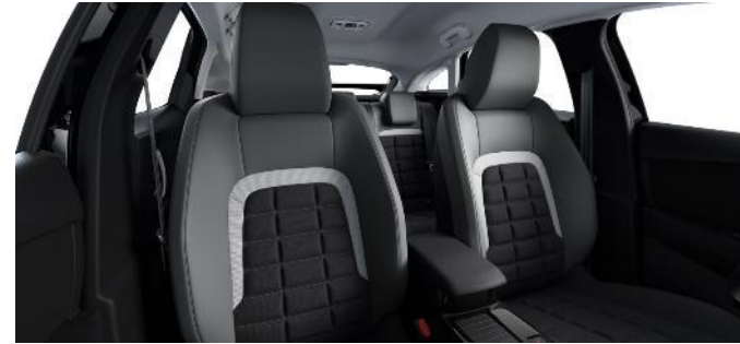
AMBIENTE URBAN GRAU - STOFF-/ Kunstleder in SCHWARZ/GRAU ADVANCED COMFORT SITZE