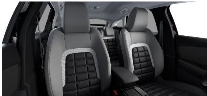
AMBIENTE METROPOLITAN GRAU KUNSTLEDER IN SCHWARZ/GRAU ADVANCED COMFORT SITZE