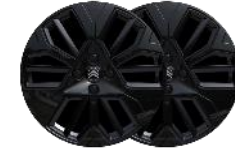
18-Zoll-Leichtmetallfelgen "Amber" Schwarz