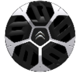
18-Zoll-Stahlfelgen mit Radzierkappen "Aerotech"