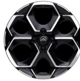
17-Zoll-Leichtmetallfelgen Atacamite mit Diamantschliff