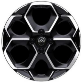
17-Zoll-Leichtmetallfelgen Atacamite mit Diamantschliff in Schwarz