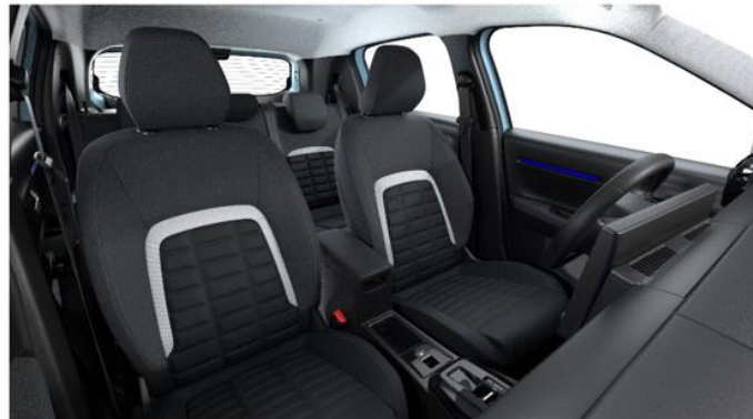
Ambiente URBAN GREY - Stoff Urban Schwarz/Grau (Mittelarmlehne zwischen den vorderen Sitzen nur für Elektro/Hybrid)