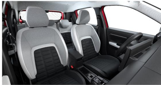
Ambiente METROPOLITAN GREY - Stoff/Kunstlederbezug Metropolitan Grey (Mittelarmlehne zwischen den vorderen Sitzen nur für Elektro/Hybrid)