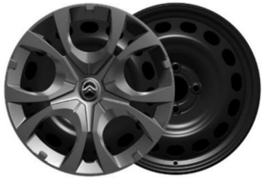
16-Zoll-Stahlfelgen mit Radzierkappen Pyrite in Mattschwarz