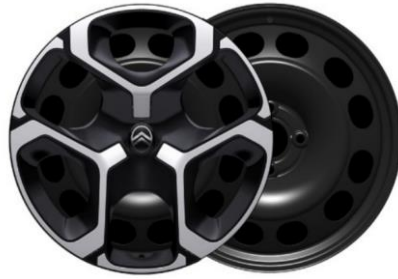
17-Zoll-Stahlfelgen mit Radzierkappen Azurite