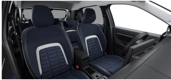
Ambiente URBAN BLUE - Stoff Urban Blau (Mittelarmlehne zwischen den vorderen Sitzen nur für Elektro/Hybrid)