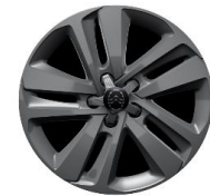
17-ZOLL LEICHTMETALLFELGE ZHJ 650,00 (773,50)