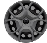
17-ZOLL-RADZIERBLENDE ZHYY Serie i.V.m. PDxx