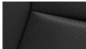
LEDER CLAUDIA CYFX Paket Luxury