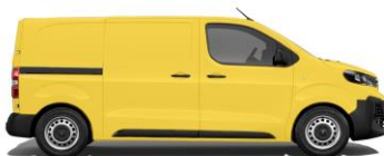
Verkehrsgelb, RAL 1023