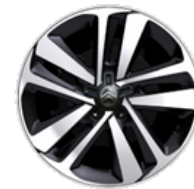
17-ZOLL LEICHTMETALLFELGE ZHJB Serie i.V.m. XTR