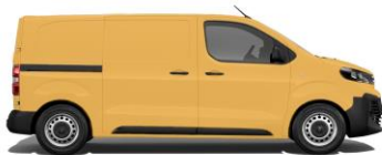
Gold-Gelb, RAL 1004