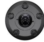
RADNABENABDECKUNG ZHYV, ZHYW, ZHZQ Serie