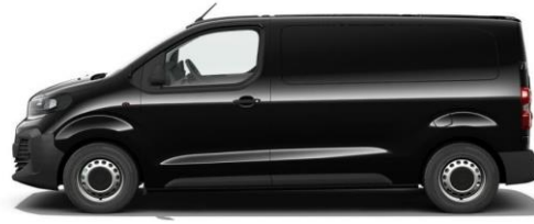
PERLA NERA-SCHWARZ M09V 650,00 (773,50)