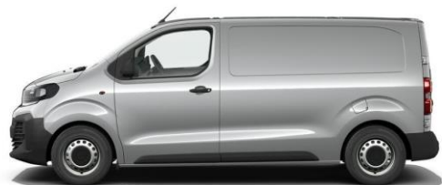
STAHL-GRAU M0F4 650,00 (773,50)