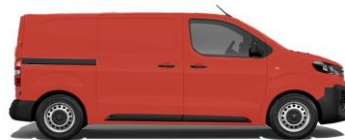
Feuer-Rot, RAL 3000