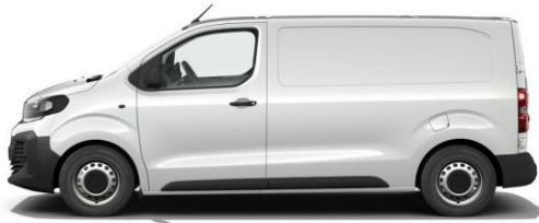
KAOLIN-WEISS POPR 0,00 (0,00)