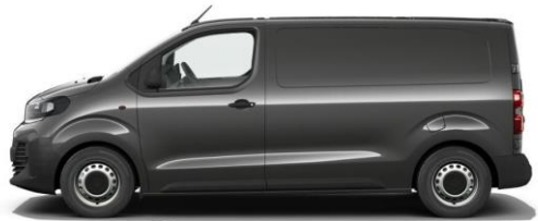
TITANIUM-GRAU M01J 650,00 (773,50)