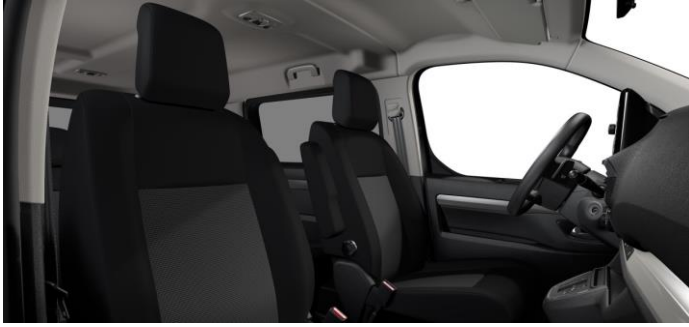
STOFF CURITIBA BLACK