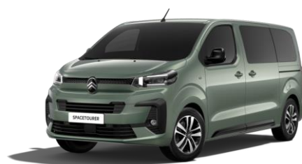
ALL TERRAIN-GRÜN (M)