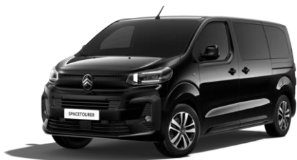
PERLA NERA-SCHWARZ (M)