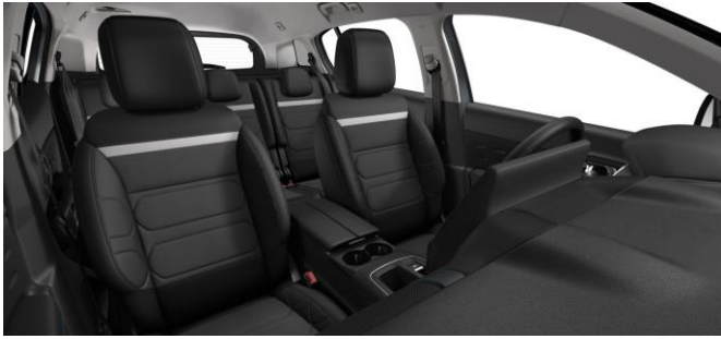
AMBIENTE METROPOLITAN BLACK