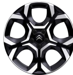
18-Zoll-Leichtmetallfelgen „Pulsar“ glanzgedreht