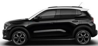
Perla Nera Schwarz (M)