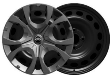
16-Zoll-Stahlfelgen mit Radzierkappen Pyrite in Mattschwarz