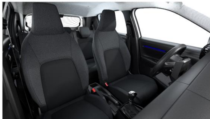
Ambiente YOU - Stoff Schwarz/Grau